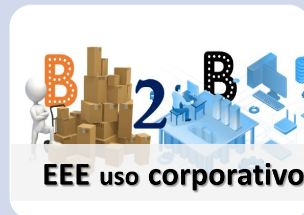
EEE uso corporativo