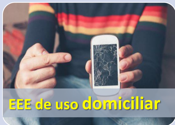
EEE de uso domiciliar